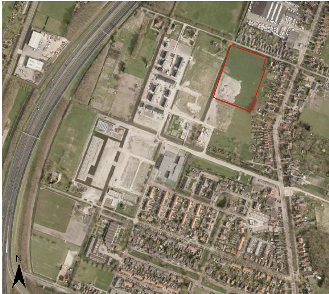
Figuur 1.1: Ligging plangebied

Het plangebied ligt ten noorden van de kern Zuidoostbeemster, in de gemeente Beemster. Het plangebied wordt aan de noordzijde begrensd door het Noorderpad en aan de oostzijde door de achtertuinen van de woningen aan de Purmerenderweg. Aan de westzijde ligt het braakliggende terrein van het plangebied 'Notarisappelstraat', en daarachter de gerealiseerde 42 woningen van plandeel De Nieuwe Tuinderij. Ten zuiden grenst het plangebied aan grasland.