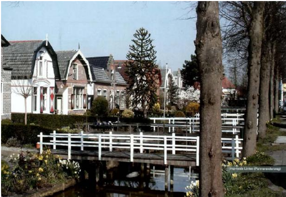
Figuur 3.1 Impressie lintbebouwing (Purmerenderweg)