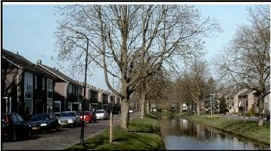
Figuur 3.2 Impressie buurten (Prinses Wilhelminasingel)