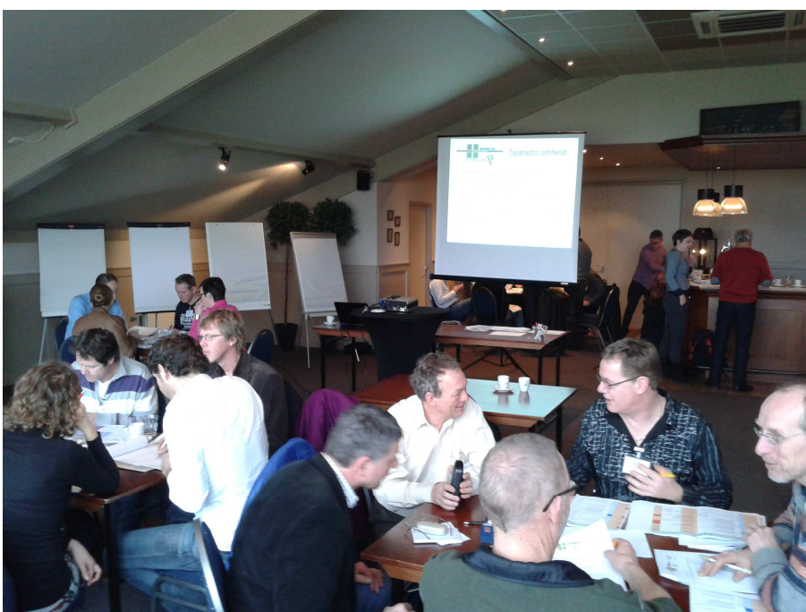
Foto genomen tijdens gezamenlijke workshop d.d. 28-2-'13.

Daarom zijn er een flink aantal vervolgspraken gemaakt, bijvoorbeeld om verder te praten over de wijze van uitvoering van de taken, maar er zijn ook afspraken gemaakt waarbij Beemstermedewerkers een dag gaan meelopen bij Purmerend. Zo'n dag meelopen staat in het kader van kennismaken met elkaar en met elkaars werkwijzen. Het gesprek over formatieoverdracht en daaraan gekoppeld het personeelsplan is in deze fase nog niet aan de orde.