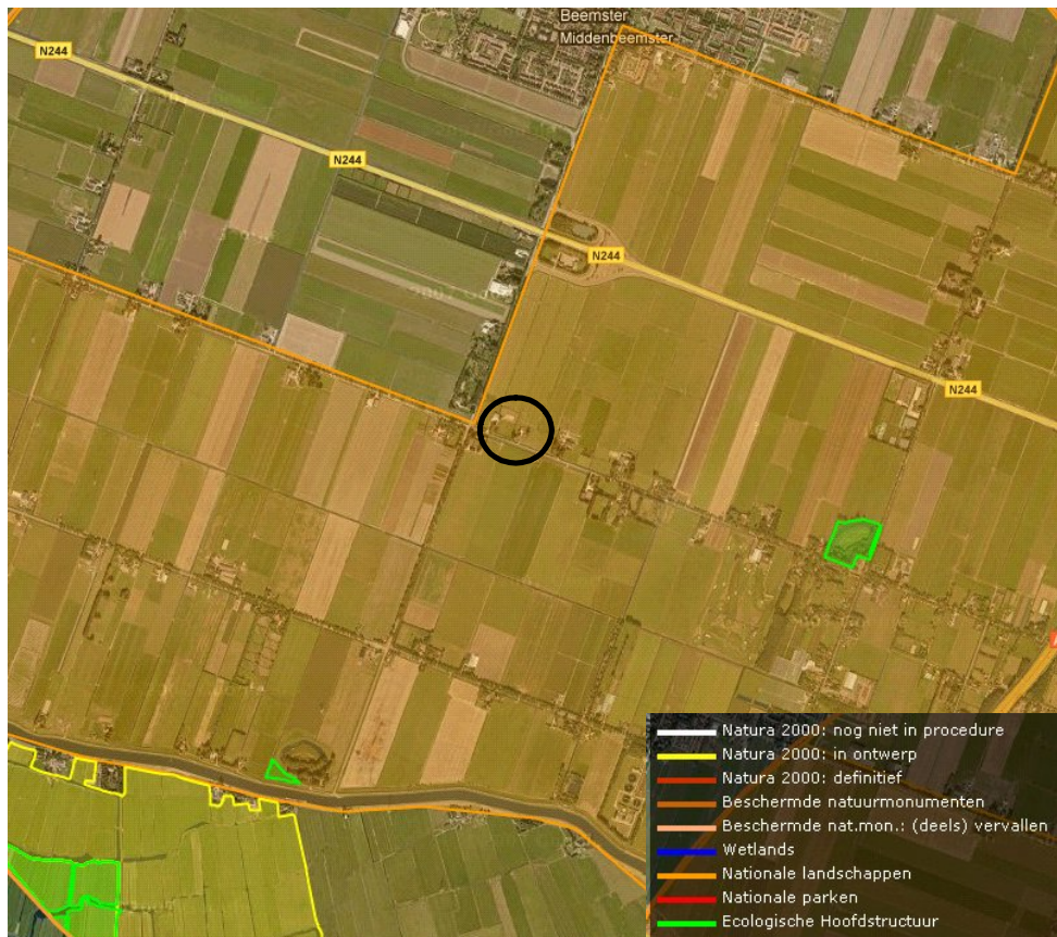
Figuur 4.2: Kaartfragment beschermde Flora en Faunagebieden

Het Rijk heeft in de Nota Ruimte op basis van een aantal specifieke kernkwaliteiten twintig Nationale Landschappen in Nederland aangewezen. Het Nationaal landschap Laag Holland is daar één van. Volgerweg 27 is gelegen in het Nationaal landschap 'Laag Holland'.